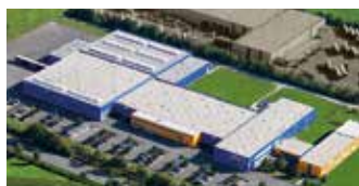
Hörmann KG Antriebstechnik, Allemagne