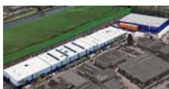
Hörmann Alkmaar B.V., Pays-Bas