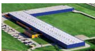
Hörmann Legnica Sp. z o.o., Pologne