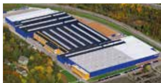
Hörmann KG Eckelhausen, Allemagne