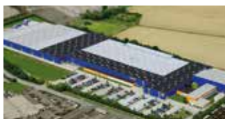
Hörmann KG Brandis, Allemagne