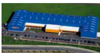
Hörmann Flexon LLC, Burgettstown PA, USA