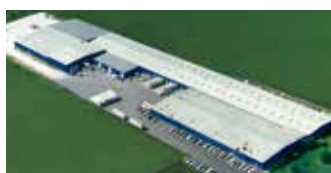
Hörmann LLC, Montgomery IL, USA