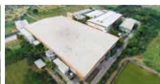
Shakti Hörmann Pvt. Ltd., Inde

En tant que seul fabricant complet sur le marché international, le groupe Hörmann propose une large gamme d'éléments de construction, provenant d'une seule source. Ils sont fabriqués dans des usines spécialisées suivant les procédés de fabrication à la pointe de la technique. Grâce au réseau européen de vente et de service, orienté vers le client et la présence sur le marché aux Etats-Unis et en Asie, Hörmann se positionne comme votre partenaire international performant pour tous les éléments de construction. Hörmann, l'assurance de la qualité.