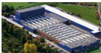
Hörmann KG Freisen, Allemagne