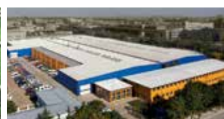
Hörmann Beijing, Chine