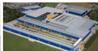
Hörmann KG Brockhagen, Allemagne