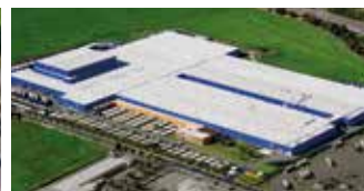
Hörmann KG Ichtershausen, Allemagne