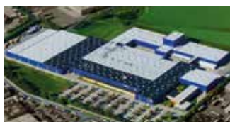
Hörmann KG Brandis, Allemagne