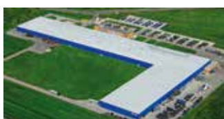
Hörmann Legnica Sp. z o.o., Pologne