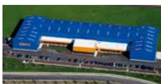
Hörmann Flexon LLC, Burgettstown PA, USA