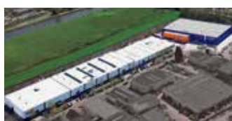
Hörmann Alkmaar B.V., Pays-Bas