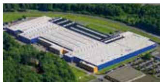
Hörmann KG Eckelhausen, Allemagne