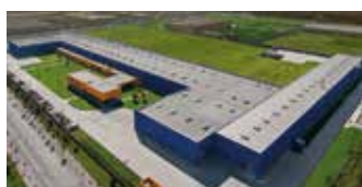
Hörmann Tianjin, Chine