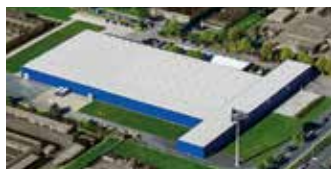
Hörmann KG Dissen, Allemagne