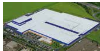
Hörmann KG Ichtershausen, Allemagne