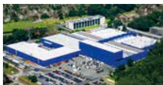
Hörmann KG Amshausen, Allemagne