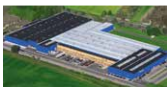
Hörmann KG Werne, Allemagne