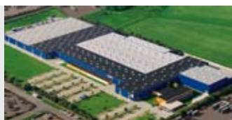
Hörmann KG Brandis, Allemagne