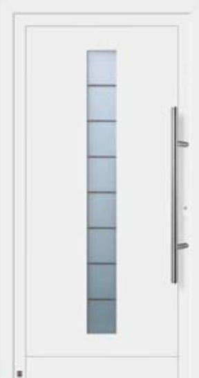
Motif 904 A en blanc trafic RAL 9016.