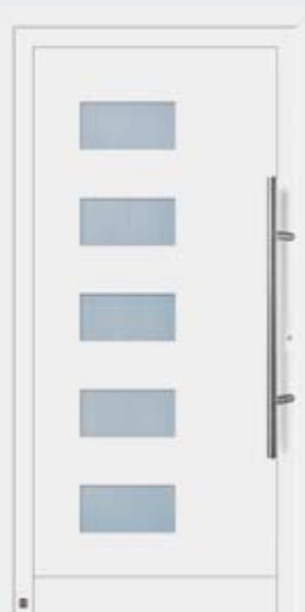
Motif 902 A en blanc trafic RAL 9016.