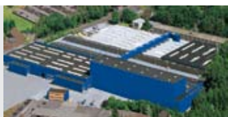
Hörmann KG Amshausen, Allemagne