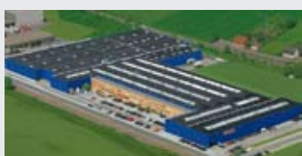
Hörmann KG Werne, Allemagne