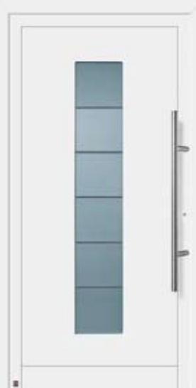
Motif 906 A en blanc trafic RAL 9016.