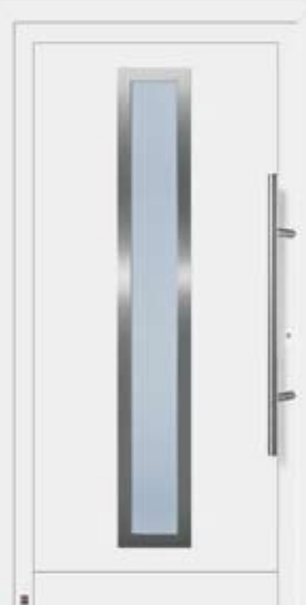
Motif 975 A en blanc trafic RAL 9016.