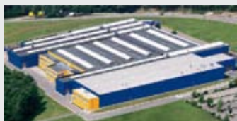
Hörmann KG Eckelhausen, Allemagne