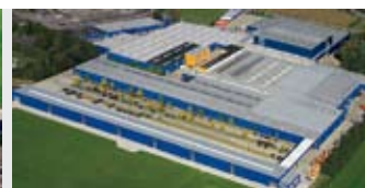
Hörmann KG Brockhagen, Allemagne