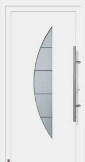
Motif 908 A en blanc trafic RAL 9016.