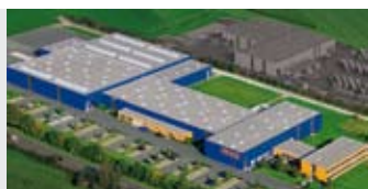
Hörmann KG Antriebstechnik, Allemagne