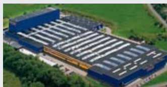
Hörmann KG Freisen, Allemagne