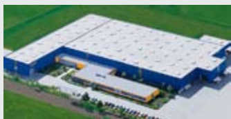
Hörmann KG Dissen, Allemagne