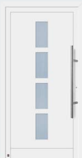
Motif 900 A en blanc trafic RAL 9016.