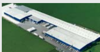
Hörmann LLC, Montgomery IL, USA