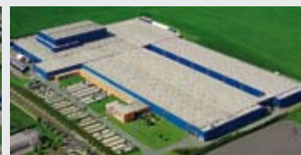
Hörmann KG Ichtershausen, Allemagne